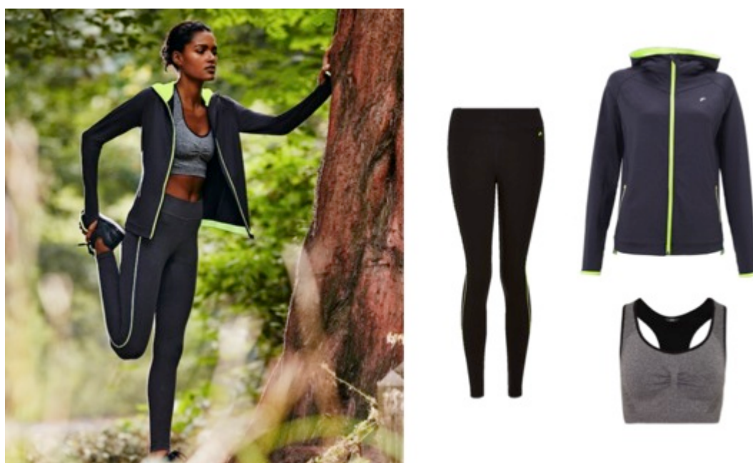
F&F Active bunda, 599 Kč; F&F Active legíny, 399 Kč; F&F Active šedá sportovní podprsenka, 279 Kč

Faktem je, že když si pořídíte trendy a stylové oblečení, které je nejen funkční, ale zároveň lichočí vaší postavě, snadněji se vám ráno vyběhne do ulic či do parku, o návštěvě posilovny ani nemluvě ☺ Kam jít? Přeci rovnou do F&F pro novou kolekci F&F Active Jaro/Léto 2016.