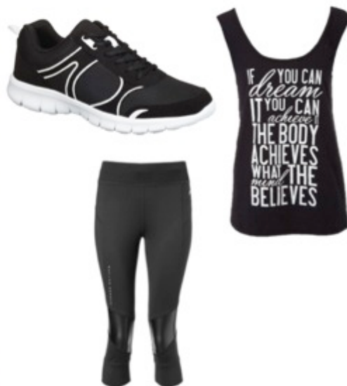
F&F Active černé botasky, 399 Kč; F&F Active tílko s potiskem, 279 Kč; F&F Active tříčtvrteční legíny, 399 Kč