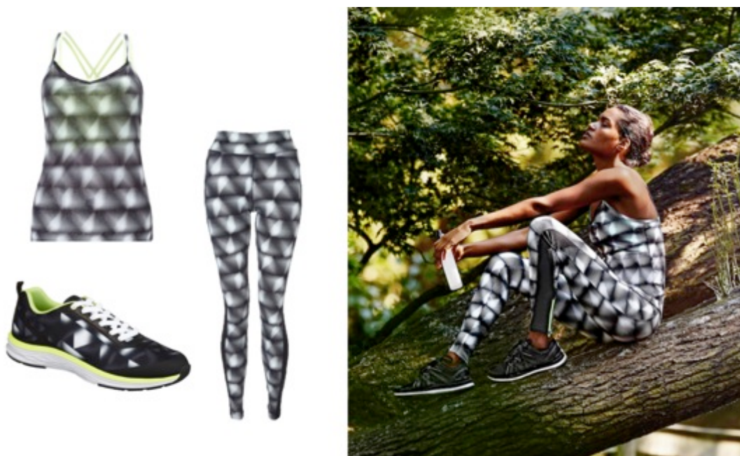
F&F Active černo-bílé tílko, 399 Kč; F&F Active černo-bílé legíny, 569 Kč; F&F Active tenisky, 629 Kč

Mít cíl znamená mít motivaci. Stanovte si ten svůj. Pokud například běháte, přihlaste se na jakýkoli běžecký závod – trénink pro vás bude určitě veselejší.